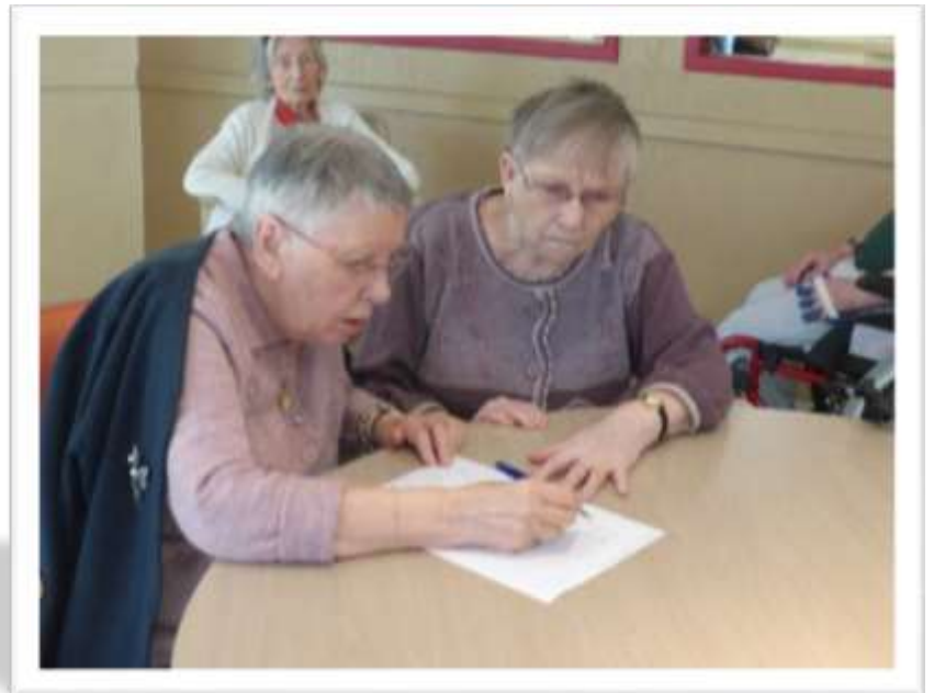
L'équipe de Lannemezan