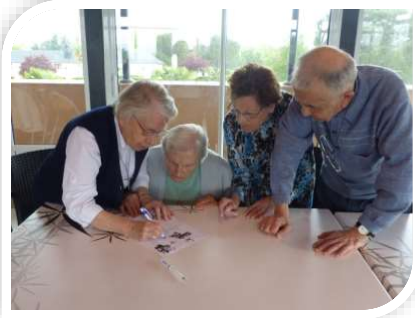
Epreuve des mots casés

Ont été disputées des épreuves d'adresse, de culture générale, de rapidité, de vocabulaire.