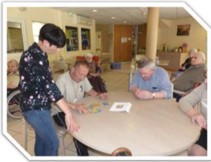
L'équipe de Cantaous