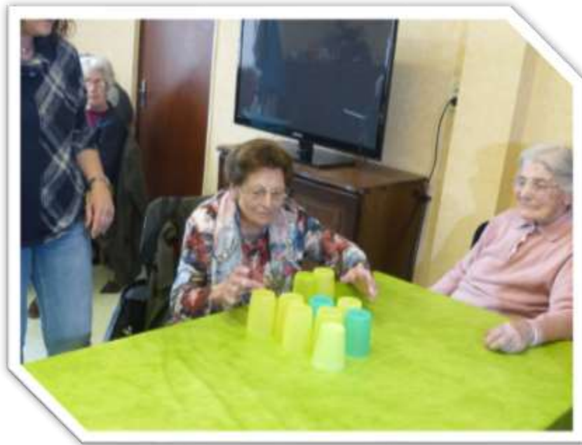
Epreuve de la pyramide de verres

Ont été disputées des épreuves d'adresse, de culture générale, de rapidité, de vocabulaire.